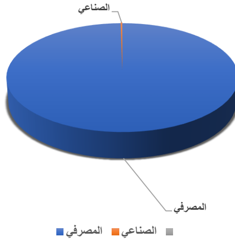
شكل رقم (2) تصنيف المودعين خلال شهر اذار / 2026